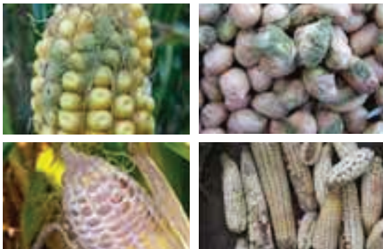
Mazao ya mahindi na karanga yenye ukungu

Sumukuvu ambazo zimeripotiwa kuwepo zaidi kwenye vyakula ni aina ya afatoxin ambayo hupatikana zaidi kwenye mahindi na karanga na aina nyingine ni fumonisin ambayo hupatikana zaidi kwenye mahindi.